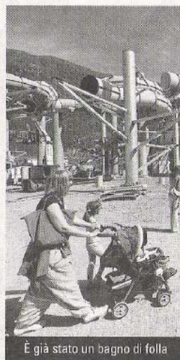
È già stato un bagno di folla

previsto di recuperare al massimo il calore in uscita - circa il 90% - e il consumo, ha anticipato il costruttore, risulterà paragonabile a quello di una palazzina. Isolatissimi sia i cinque